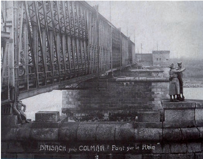
Die Rheinbrücke Breisach-Colmar vor dem Zweiten Weltkrieg

weiter über Freiburg, Donaueschingen, Ulm und München vor. Dieses Großprojekt hat sich jedoch nicht realisieren lassen.