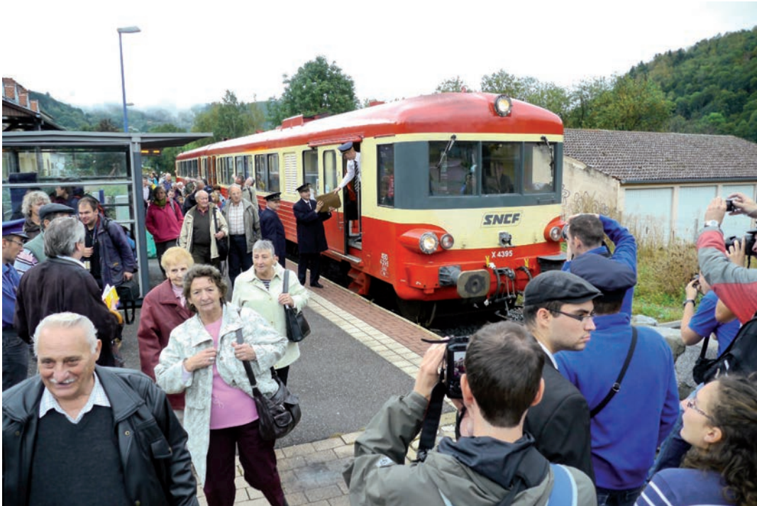
Sonderfahrt zwischen Colmar und Volgelsheim 2012

zwischen Freiburg und Colmar wieder aufleben zu lassen. Auch gab es mehrere gründliche Untersuchungen der Möglichkeiten, die Strecke wieder aufzubauen. Die letzte größere Studie wurde 2004 von der Region Elsass und dem Zweckverband Regio-Nahverkehr Freiburg beauftragt und vorgestellt. Sie untersuchte fünf verschiedene Varianten der Streckenführung über Rhein und Rhein-Seitenkanal sowie der Bedienung und kam zu dem Ergebnis, dass es je nach Variante zwischen 37 und 75 Millionen € kosten würde, die notwendigen Brückenbauwerke zu errichten und die marode Strecke zwischen den Bahnhöfen Volgelsheim und Colmar auf den neuesten Stand der Technik zu bringen. Die günstigste Variante beschrieb die Möglichkeit, die Schiene auf die bestehende Straßenbrücke zu legen, und während