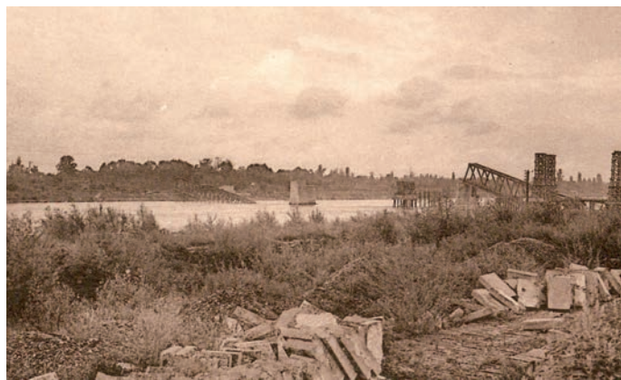
Die 1939 zerstörte Rheinbrücke

zwischen Freiburg und Colmar eine entscheidende Zäsur werden, die leider bis heute fatal nachwirkt. Nachdem bereits 1939 die französische Armee auf dem Rückzug die Rheinbrücke zerstört hatte, wurde sie zwar von der deutschen Seite als Verbindung ins besetzte Elsass rasch wiederaufgebaut. Doch am 5. Februar 1945 lag sie erneut in Trümmern. Diesmal waren es deutsche Truppen, die die eine Hälfte der Brücke sprengten, um den »End-