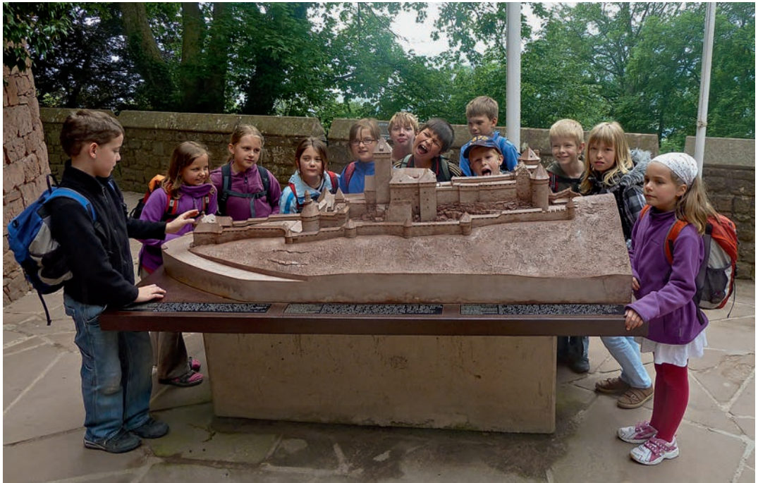
Besuch der Hochkönigsburg von Partnerschülern aus Waldkirch und Sélestat

Druwe, in einem Interview mit der Badischen Zeitung. Nach einer langen Anlaufphase werde der Fremdsprachenunterricht nun adäquat von eigens dafür ausgebildeten Lehrkräften erteilt. »Erst jetzt«, so Druwe, »kann man prüfen, was es bringt. Ich finde es deshalb kontraproduktiv, ihn gerade jetzt um zwei Jahre zu kürzen.« 11