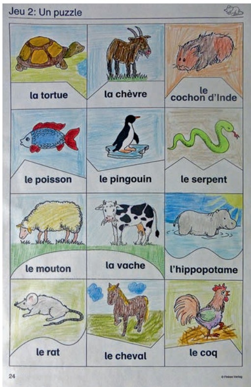
Arbeitsblatt