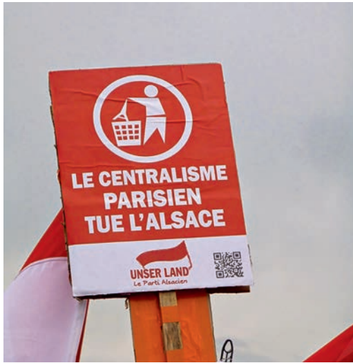
»Unser Land«: Der Pariser Zentralismus tötet das Elsass