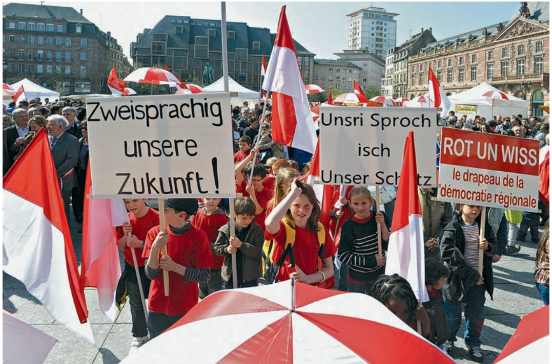
Zweisprachig unsere Zukunft – Unsri Sproch isch Unser Schatz

Französisch zu sprechen, während die elsässische Muttersprache als altmodisch und karrierehemmend verächtlich gemacht wurde. Als Ergebnis dieser historisch bewegten Dualität ist festzuhalten, dass heute die Frankophonie alle öffentlichen und privaten Lebensbereiche dominiert, die deutsche Sprache faktisch zur Fremdsprache geworden ist und der einheimische Dialekt vom Aussterben bedroht ist. Dieser Uniformisierungsprozess ist jedoch nicht nur dem jakobinischen Zentralismus und seiner traditionellen Intoleranz gegenüber regionalen Minderheiten und ihrem spezifischen Kulturerbe geschuldet. Er hat vor allem auch damit zu tun, dass die elsässischen Eliten und hier vor allem auch die konservativ-bürgerlichen Parteien, die traditionell die politische