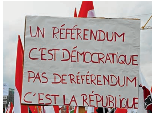
Ein Referendum, das ist demokratisch – kein Referendum, das ist die Republik

Als Speerspitze der Regionalisten/Autonomisten profilierte sich die 2009 aus der ökologischen Bewegung entstandene Partei »Unser Land«. 13 Von ihrer Programmatik her eine authentische Regionalpartei hatte sie an dem für viele überraschend starken Wiederaufleben des elsässischen Identitätsbewusstseins maßgeblichen Anteil. Programmatisch setzt sie sich für die allgemeine Vertretung der Interessen des Elsass, vor allem aber für die Pflege und Bewahrung seiner kulturellen, sprachlichen und rechtlichen Besonderheiten ein. Schon bei den Départementwahlen im Früh-