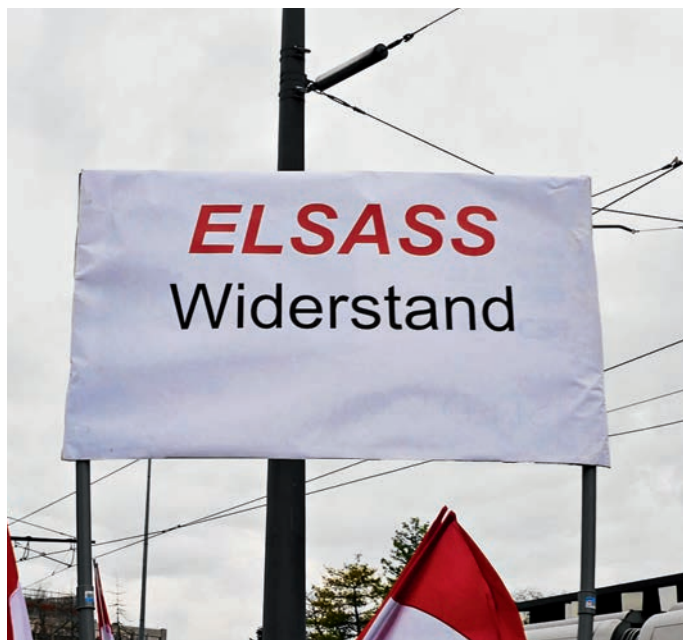
Widerstand gegen die Territorialreform

Dass sich im Elsass eine solche Protestwelle über viele Monate hinweg organisierte, kam auch für das politische Frankreich überraschend. Die elsässische Mentalität ist traditio-