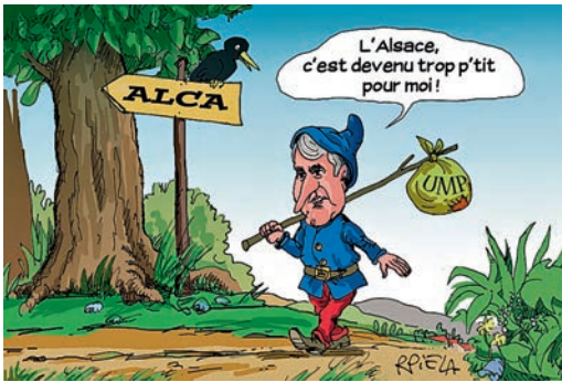
Philippe Richert: Das Elsass ist für mich zu klein geworden

bereit waren, sich mit der von ihnen als unabwendbar bezeichneten neuen Realität abzufinden. Auf der anderen Seite stand das Lager der Regionalisten/Autonomisten, die weiterhin gegen die Fusion Sturm liefen und entschlossen waren, ihren Prinzipien treu zu bleiben und den Widerstand unbeirrt fortzusetzen.