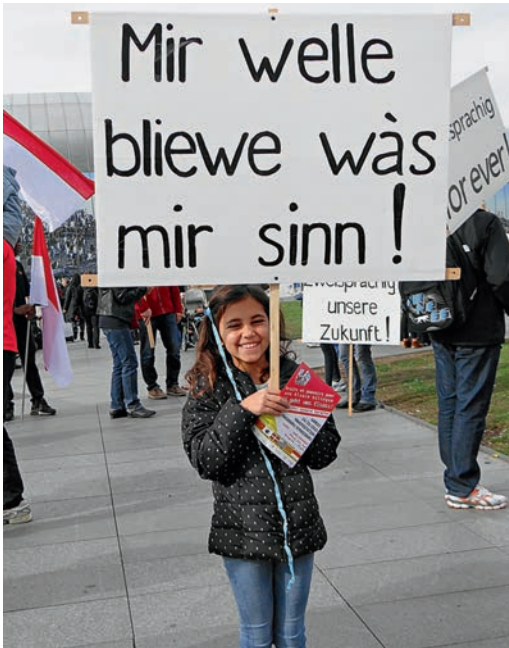
Mir welle bliewe was mir sinn

chen des Elsass zu machen und so die Regionalkultur neu zu beleben. Der bilingual-paritätische Sprachunterricht vor allem in den Grundschulen, aber auch in den Vorschulen, den écoles maternelles , wurde vor allem auf Wunsch junger Eltern systematisch ausgebaut, die Rolle des Deutschunterrichts im Elsass abgesichert und Auftrag und Ausstattung des elsässischen Sprachamts OLCA (Office pour la Langue et la Culture d'Alsace), das der Förderung des Dialektes und der regionalen Kultur dient, erweitert und verbessert. 17 Zunehmend wird so auch gerade jungen Menschen bewusst, dass es die sprachliche und kulturelle Dualität ist, die das Elsass in einer privilegierten Weise dazu befähigt, im künftigen Europa der Regionen eine Brückenfunktion zwischen Frankreich und Deutschland wahrzunehmen. Dies bedeutet eine große Chance,