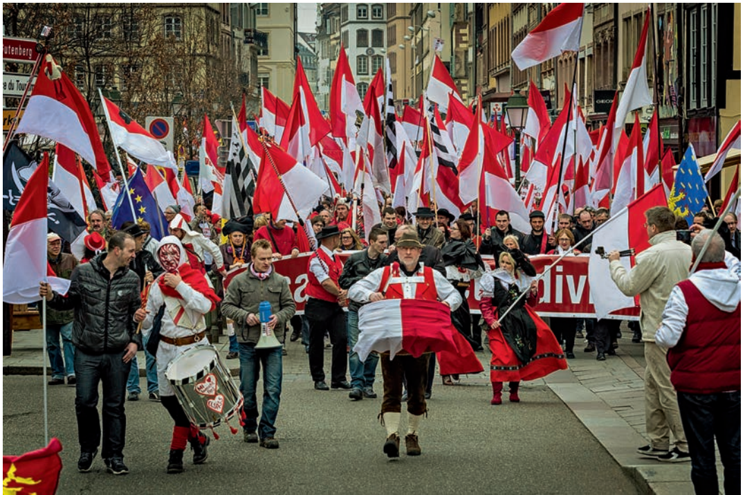
Demonstration gegen die Fusion in Straßburg

ten und für die Abhaltung eines Referendums der Initiative »Alsace retrouve ta voix« kamen 115 000 Unterschriften zusammen. Zusätzlich kam es in zahlreichen Städten und Gemeinden zu einer Welle von Demonstrationen und Aktionen. Höhepunkt war eine große Kundgebung gegen die Zwangsfusion in Straßburg am 11. Oktober 2014, an der sich über 10 000 Personen beteiligten. Aufgerufen hierzu hatte ein breites Bündnis der oppositionellen UMP, der regionalen Wirtschaftskammern, mehrerer elsässische Regionalparteien sowie einer Reihe von Organisationen aus der Zivilgesellschaft. In einem Meer von rot-weißen Fahnen waren Spruchbänder oder Slogans wie »Alsace libre-freies Elsass«, »Le centralisme parisien tue l'Alsace« oder »Mir welle bliewe was mir sin« zu lesen. Quer durch alle soziale