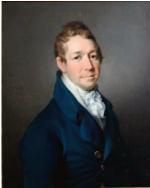
Anonym, Georg Heinrich von Langsdorff, o.J.