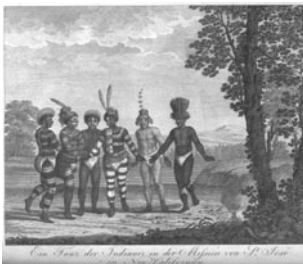
Kupferstich mit indigener Bevölkerung am Süden der San Francisco Bay im zweiten Band der „Bemerkungen“ Langsdorff über seine Weltreise von 1803 bis 1807