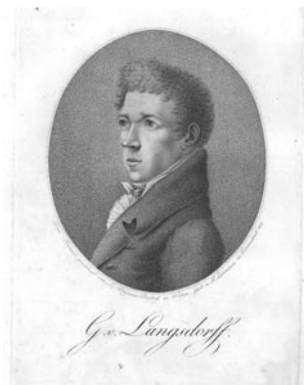
Georg Heinrich von Langsdorff, Porträt (Kupferstich), in seinem Buch „Bemerkungen auf einer Reise um die Welt“ von 1812