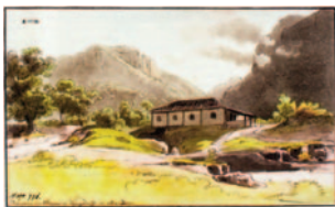
Der Maler Thomas Ende hielt um 1818 die Wohnung Langsdorffs in Mandioca fest.