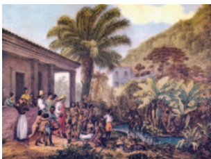
Dorfbewohner der brasilianischen Fazenda in Minas Gerais, festgehalten vom Maler Moritz Rugendas 1824. Rugendas war Begleiter Langsdorffs auf dessen Brasilienexpedition 1822.

Rechte: wikipedia gemeinfrei, https://de.m.wikipedia.org/wiki/Datei:Mandioca-Th_Ender.jpg