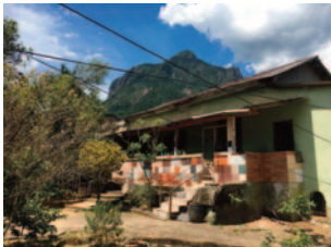
Das einzige noch heute stehende Gebäude der Fazenda Mandioca.