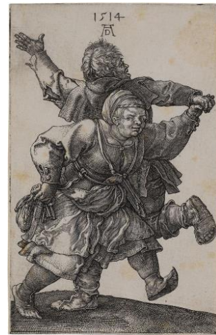
Albrecht Dürer, Das tanzende Bauernpaar, 1514 (Staatsgalerie Stuttgart)

Anmeldung bis zum 28.1.2025 mit Angabe, ob Sie einen Museumspass besitzen.